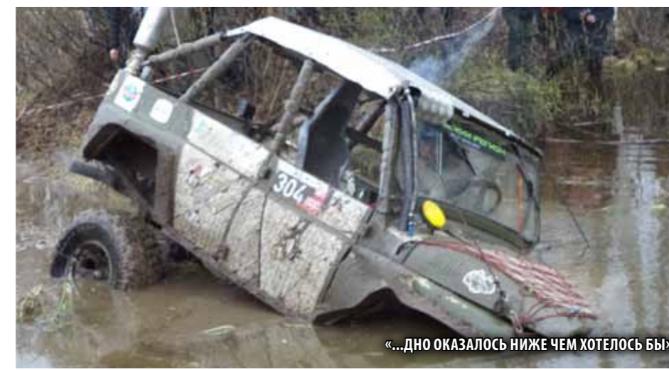
«...ДНО ОКАЗАЛОСЬ НИЖЕ ЧЕМ ХОТЕЛОСЬ БЫ»

По ходу Пролога случалось всякое: ломалась подвеска, горела, не выдержавшая напряжения, проводка, дымилась лебедки, тонули машины. В результате некоторые участники «финишировали» на «галстук» с середины дистанции. Кто знает, может по-своему были правы те, кто сдал назад и поберег свои агрегаты для основной части соревнований. Судить не мне. Но глядя, как азартное развлечение подчас превращалось в тяжелую, изнурительную работу, с каким несгибаемым упорством эти люди двигались к своей цели, невольно проникаешься глубоким уважением к этим «сумас-