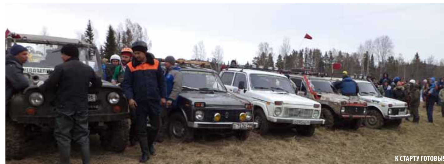
К СТАРТУ ГОТОВЫ!