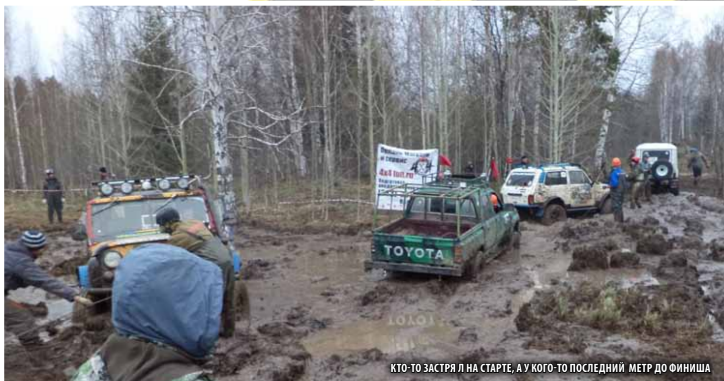
КТО-ТО ЗАСТРЯЛ НА СТАРТЕ, А У КОГО-ТО ПОСЛЕДНИЙ МЕТР ДО ФИНИША

Каждая секция имеет свой неповторимый, уникальный ландшафт и особое задание, которое необходимо выполнить как можно быстрее. Например, проехать триальный участок длиной 50 метров, или преодолеть грязевую лужу. Отсечку старта и финиша выполняет водитель экипажа, самостоятельно нажимая на кнопку секундомера.