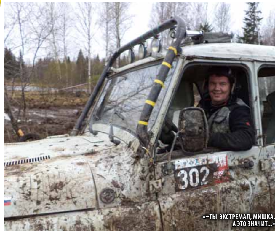
«ТЫ ЭКСТРЕМАЛ, МИШКА, А ЭТО ЗНАЧИТ...»