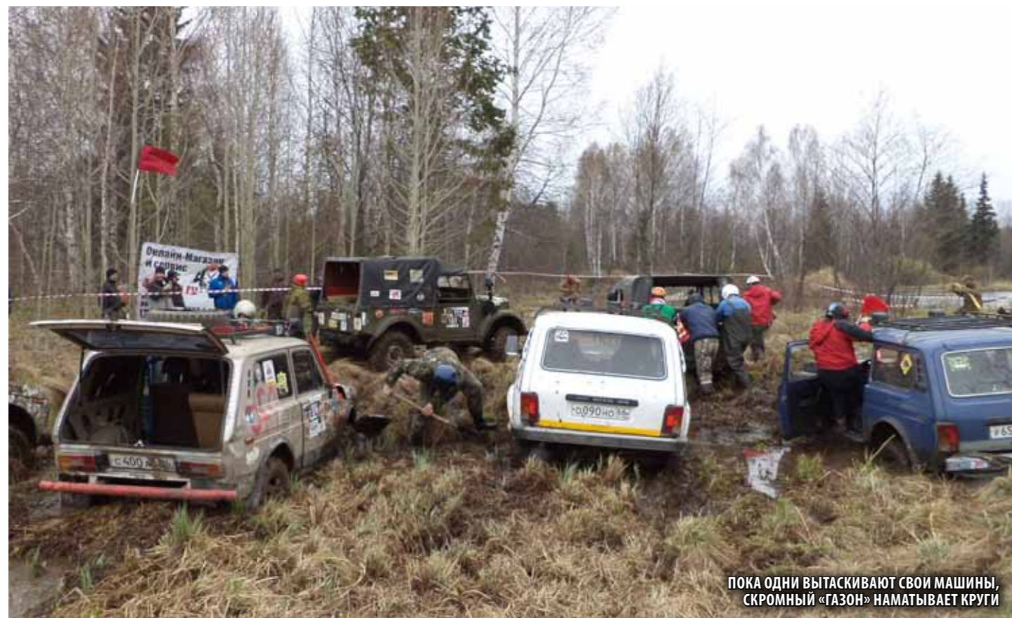
ПОКА ОДНИ ВЫТАСКИВАЮТ СВОИ МАШИНЫ, СКРОМНЫЙ «ГАЗОН» НАМАТЫВАЕТ КРУГИ

Скромный Газ-69 будто посуху пролетел по, поросшему осокой, болоту, совершил два положенных круга, и так же бодро, выбрасывая грязь из под колес, вернулся обратно. Могло бы показаться, что организаторы перестраховались с трассой, но вид остальной группы, засевшей по самые двери, буквально на первых метрах дистанции, говорил об обратном. Надо отметить, что успех в подобных заездах зависит не только от профессионализма пилота, но в большей степени от слаженности и четкой работы всей команды. Пока машина едет, ей не мешают, как только встречаются трудности штурман и механик бросаются на помощь. Идут в ход лебедки, «хай джеки», сендтраки. Любими доступными способами машину метр за метром двигают к финишу. Главное, чтобы машина достигла финиша своим ходом, своими силами. При этом «якориться» за деревья и, стоящие на «берегу» машины, правилами соревнований не запрещалось. Вода буквально закипала под колесами машин. Постепенно соревновательный момент отошел на второй план и превратился в общесозидательный: команды других экипажей помогали выдергивать из жижи машину соперника. Казалось, помогают